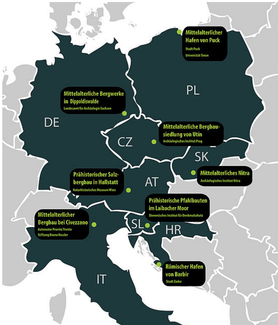
Pilotregionen und Partner des VirtualArch-Projektes

Ziel des internationalen Projektes ist es, das Bewusstsein für den Wert archäologischer Denkmäler und Funde in der Öffentlichkeit zu schärfen. Gemeinsam mit lokalen und regionalen Akteuren wird es künftig besser möglich sein, archäologische Fundstellen wie untertägige Bergbaulandschaften virtuell und räumlich darzustellen. Durch eine dreidimensionale Erlebbarkeit und Inszenierung kann die Archäologie den Tourismus vor Ort fördern, sie ermöglicht aber auch ein besseres Verständnis und fördert die Entwicklung von Schutzstrategien in Hinblick auf künftige Infrastrukturvorhaben. Das zwischen 2017 und 2020 laufende Projekt wird vom Bundesprogramm Transnationale Zusammenarbeit gefördert.